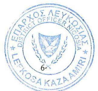
Δρ Θεόδωρος Θεοδώρου Γραμματέας